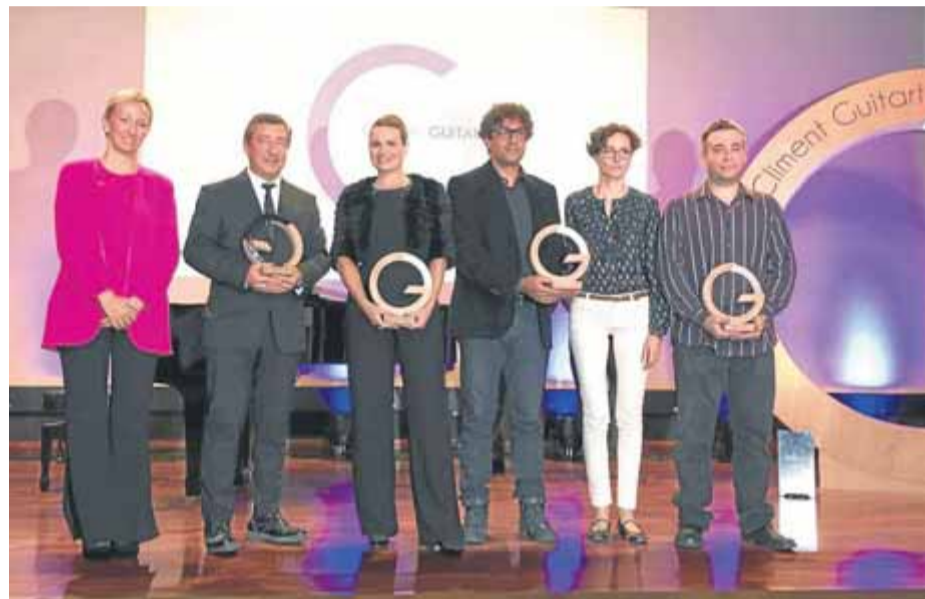
Els premiats, ahir a la nit després de rebre els guardons ■ GUITART HOTELS

Dins l'àmbit de la formació, el jurat va renovar