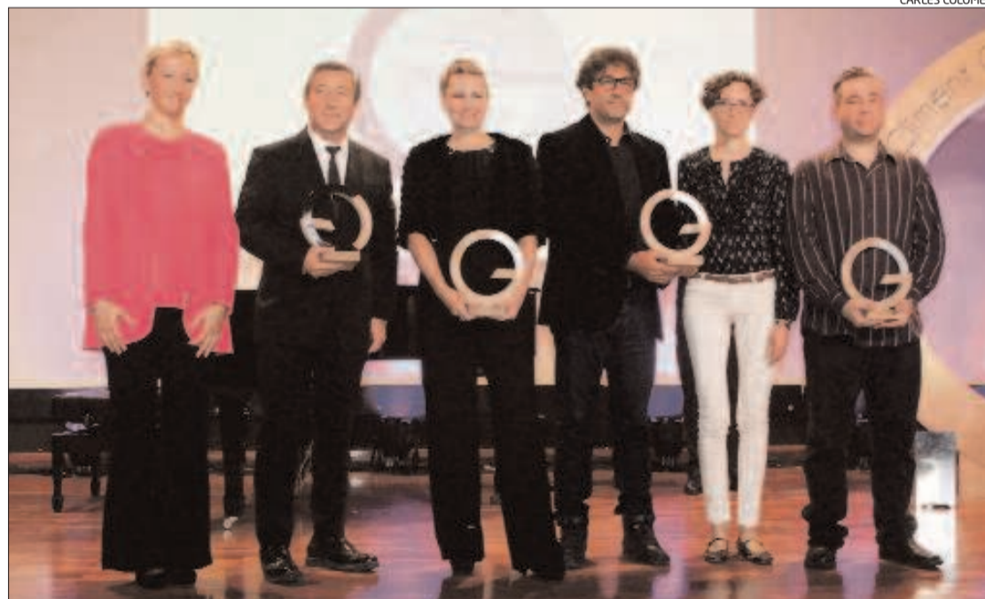
Foto de grup dels guardonats ahir amb els premis Climent Guitart.