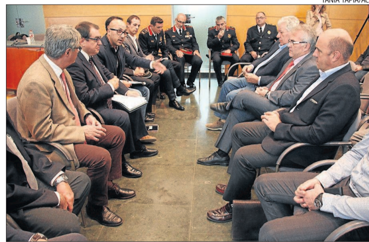
Imatge general de la junta de seguretat de Lloret, celebrada ahir.

Malgrat que la xifra global és bona, la nota negativa la marquen el registre de robatoris amb violència i/o intimidació, que augmenten un 32%. Segons les dades policials, durant el darrer any s'ha passat de 50 a 62 atracaments a l'espai públic i també s'han incrementat les estrebades (de 14 a 25). Són aquests tipus de delictes, precisament, un dels que generen més sensació d'inseguretat entre la