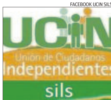
El logotip del nou partit a Sils.