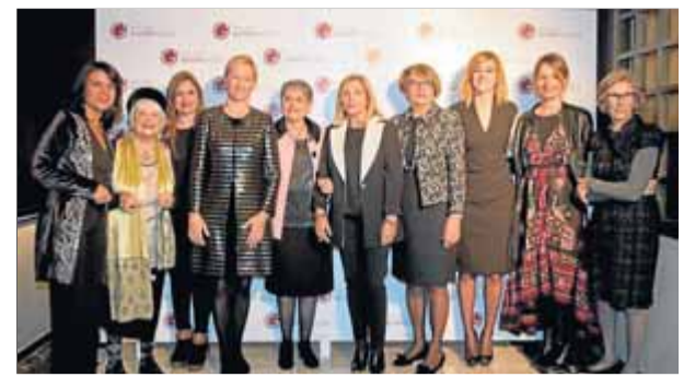
Algunes de les assistents al sopar de dones solidàries dut a terme ahir a Lloret de Mar

just al seu costat. Les obres han tingut un cost de 9.300 euros, i els departaments de Cultura i Arxiu Municipal s'encarregaran dels continguts de l'espai, que ha de servir per difondre el treball dels artistes blanencs. ■