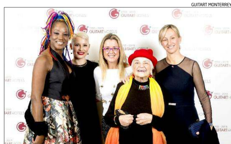
Un moment del sopar solidari, ahir a l'hotel Guitart Monterrey de Lloret.

ganització del sopar i dels sortejos solidaris, els quals han ajudat en la recaptació per la causa solidària. La presidenta de Guitart Hotels va destacar que «la protagonista d'aquesta nit és la lluita contra el càncer de mama». Cabañas va recordar que «des de Guitart Hotels donem suport a causes solidàries com aquesta a través de diversos esdeveniments anuals». El programa «Molt Per Viure» es desenvolupa a l'Associació Espanyola Contra el Càncer des del 1987.