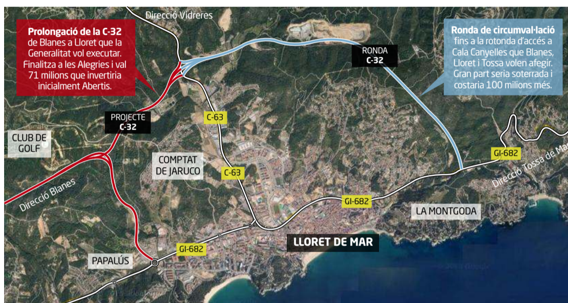
Font: Ajuntament de Lloret de Mar.